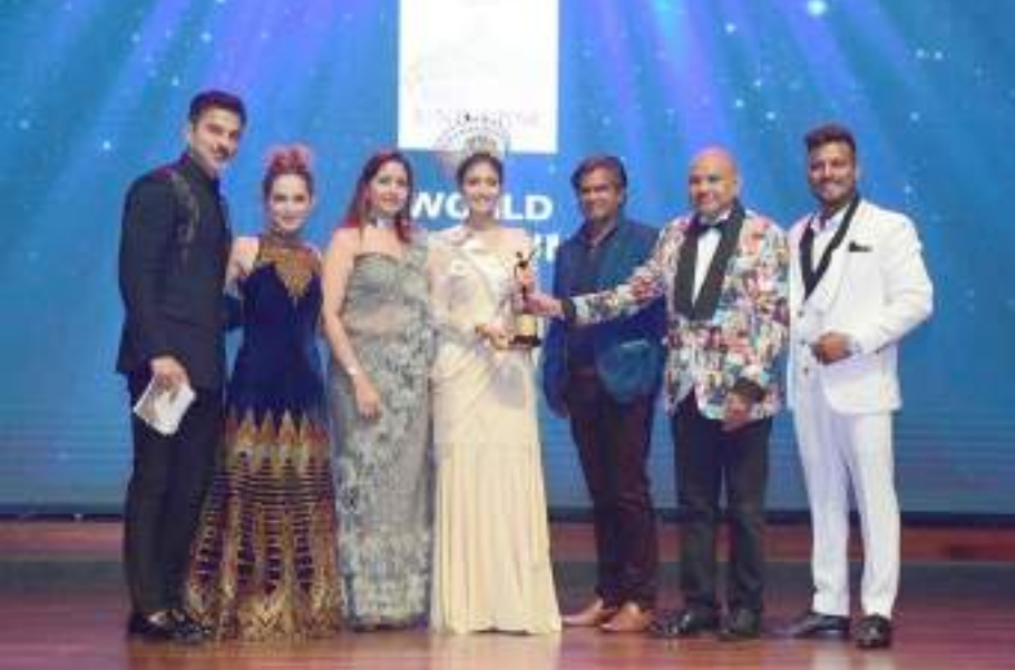
ନିଜକୁ ସର୍ବୋତ୍ତମ ଭାବେ ପ୍ରଦର୍ଶିତ କରିବା ନିମନ୍ତେ ଉତ୍ତମ କୃତ୍ୱ କରିଆସୁଥିଲେ। ମିସେସ୍ ଇଣ୍ଡିଆ ସୁନିଭର୍ସ ୨୦୧୯ରେ ଭୁବନେଶ୍ୱର ଅତିସନ୍ଦର୍ଭରେ ରାଜ୍ୟର ବିଭିନ୍ନ ସହରରୁ ପ୍ରାୟ ୬୦ ଜଣ ମହିଳା ଭାଗ ନେଇଥିଲେ, ସେଥିମଧ୍ୟରୁ ୫ ଜଣଙ୍କୁ ଜାତୀୟସ୍ତରରୁ ଚୟନ କରାଯାଇଥିଲା। ମିସେସ୍‌ରେ ଆୟୋଜିତ ଏହାର ଜାତୀୟସ୍ତର ପ୍ରତିଯୋଗିତାରେ ଭାରତର ବିଭିନ୍ନ ରାଜ୍ୟରୁ ପ୍ରାୟ ୪୦ ଜଣ ପ୍ରତିଯୋଗୀ ଭାଗ ନେଇଥିଲେ। ଏହି କାର୍ଯ୍ୟକ୍ରମ ମୁଖ୍ୟମନ୍ତ୍ରୀ ମିସେସ୍ ଇଣ୍ଡିଆ ସୁନିଭର୍ସ ଗୋଲ୍ଡ ଏବଂ ମିସେସ୍