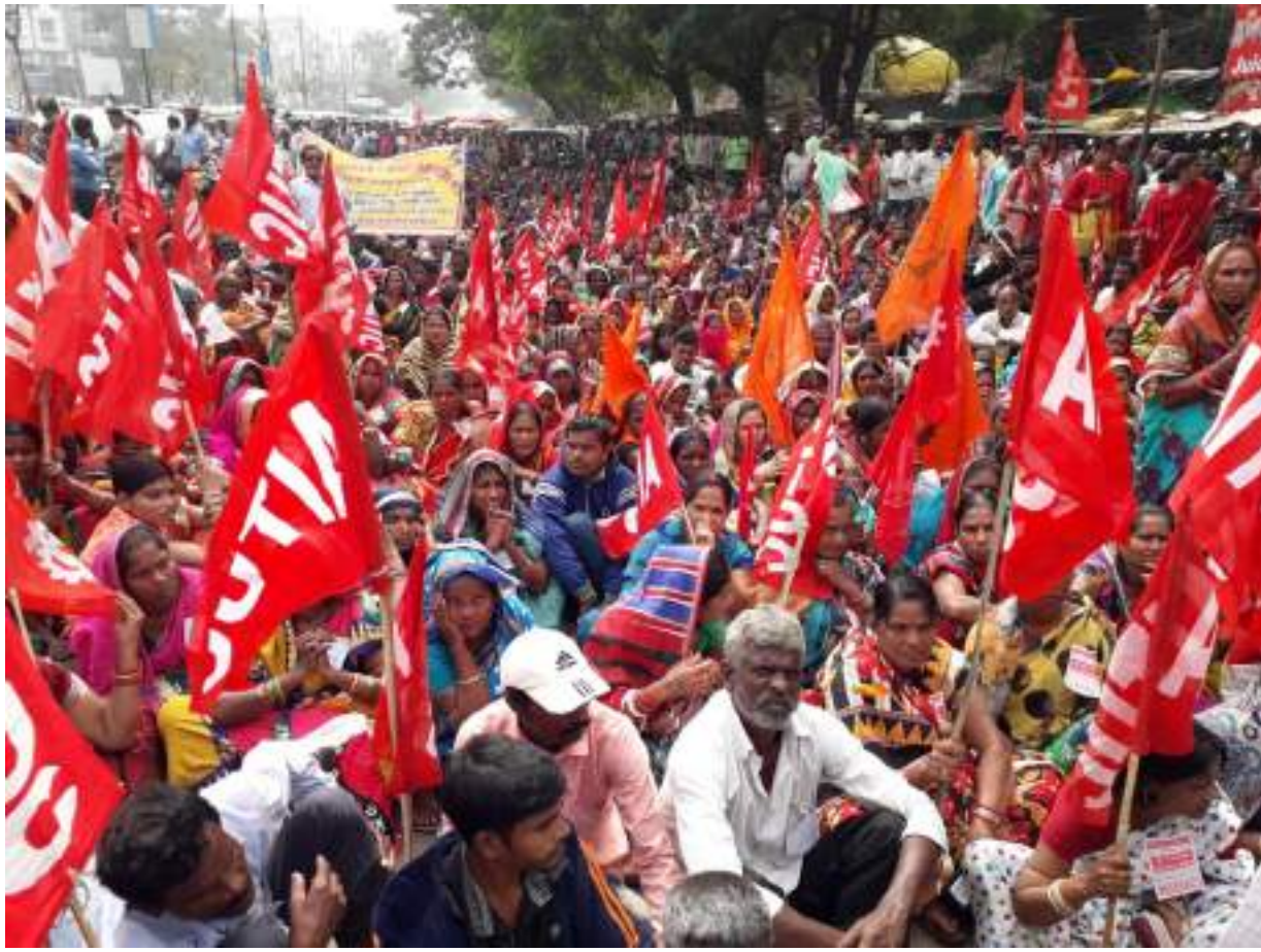
ନିର୍ମାଣ ଶ୍ରମିକ ସୁନିୟମ ସମନ୍ୱୟ କମିଟି ତାଙ୍କଦ୍ୱାରା ଶ୍ରମ କମିଶନରଙ୍କ କାର୍ଯ୍ୟାଳୟ ସମ୍ମୁଖରେ ବିଶାଳ ବିକ୍ଷୋଭ