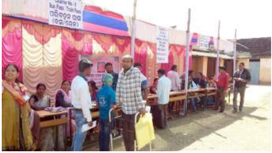
ରକ୍ତା ୫୯ଜଣ, ଭେକ୍ସକ ମାଳଶ, ସ୍ୱାସ୍ଥ୍ୟଗତ, ମାନସିକ ବିକୃତରେ ୫୫ଜଣ, ଶ୍ରବଣ ବର୍ଦ୍ଧିତ, ରକ୍ତହୀନତା, ବାକ ଶକ୍ତି ହୀନତା ୩୨ଜଣ ପ୍ରଭୃତି ବିଭାଗ ଗୁଡ଼ିକରେ ରୋଗୀ ମାନେ ଉପସ୍ଥିତ ରହି ସେମାନଙ୍କର ସ୍ୱାସ୍ଥ୍ୟ

ନେତୃତ୍ୱରେ, (ପିଏନ): ଭିନ୍ନସମ ମାନଙ୍କୁ ସମାଜର ବୋଝ ନଭାବି ସେମାନଙ୍କୁ ପଢ଼ାଇ ଦେବା ଓ ସହାୟତା ଦେଇ ସମାଜର ଭୂଖଣ୍ଡ ଖୋଳିବା ପାଇଁ କର୍ମକାରୀଙ୍କୁ ଉତ୍ସାହ ଦେବାକୁ ପ୍ରୋତ୍ସାହନ ଦେବାକୁ ପ୍ରୟାସ କରାଯାଇଛି । ମାତ୍ର ପ୍ରଶାସନିକ ଅବହେଳା ଓ ଲକ୍ଷ୍ୟ ଶିବିର ଅଭାବ ସହିତ ପ୍ରଚାର ପ୍ରସାର ନହେବା ଫଳରେ ବହୁ ବିଦ୍ୟାର୍ଥୀ ଆଜି ବଡ଼ଚଣା ବୁକ୍ ଅପରଟ ଧାନମଣ୍ଡଳ ଉପ ବିଦ୍ୟାଳୟ ପରିସରରେ ବଡ଼ଚଣା ପଞ୍ଚାୟତ ସମିତି ସାମାଜିକ ସୁରକ୍ଷା ଓ ଭିନ୍ନସମ ସମ୍ବଳିତରଣ ବିଭାଗ ଓଡ଼ିଶା ସରକାରଙ୍କ ତରଫରୁ ଏକ ଶିବିର ଅନୁଷ୍ଠିତ ହୋଇଥିଲା । ଏହି ଶିବିରରେ ମୋଟ ୨୮୬ ଜଣ ମଧ୍ୟରୁ ଅଧିକାଂଶ ବିଭାଗରେ ୧୩୭ଜଣ, ଚଷ୍ମା ନାଶା ଓ