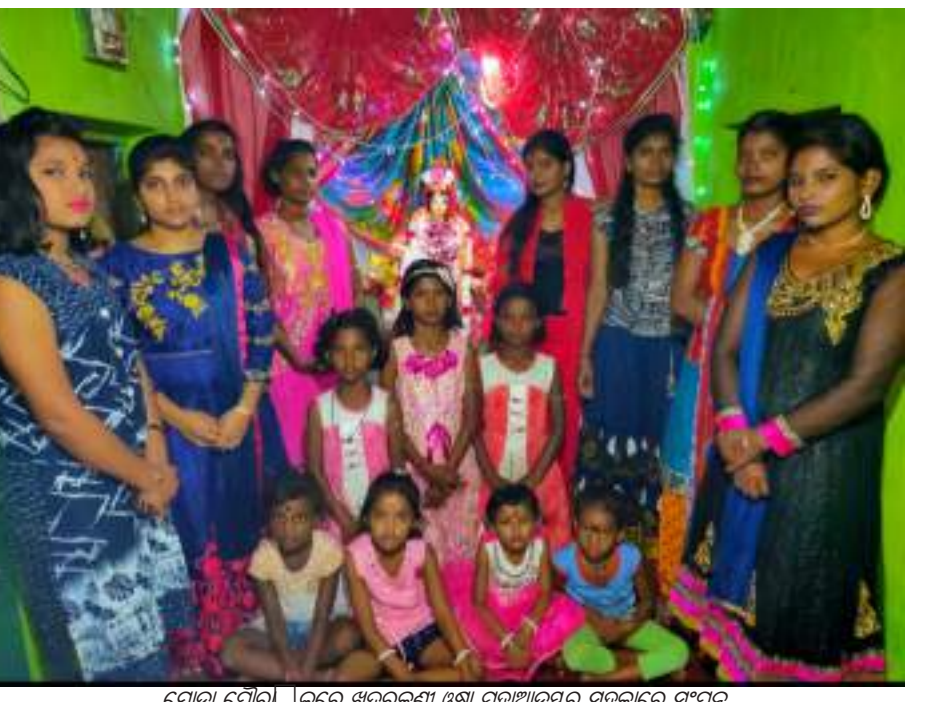
ଯୋଗା ପୋଲିସରେ ଖୁଦୁରୁକୃଷୀ ଓ ଶା ମହାଆପର ସହକାରେ ସଂପଦ