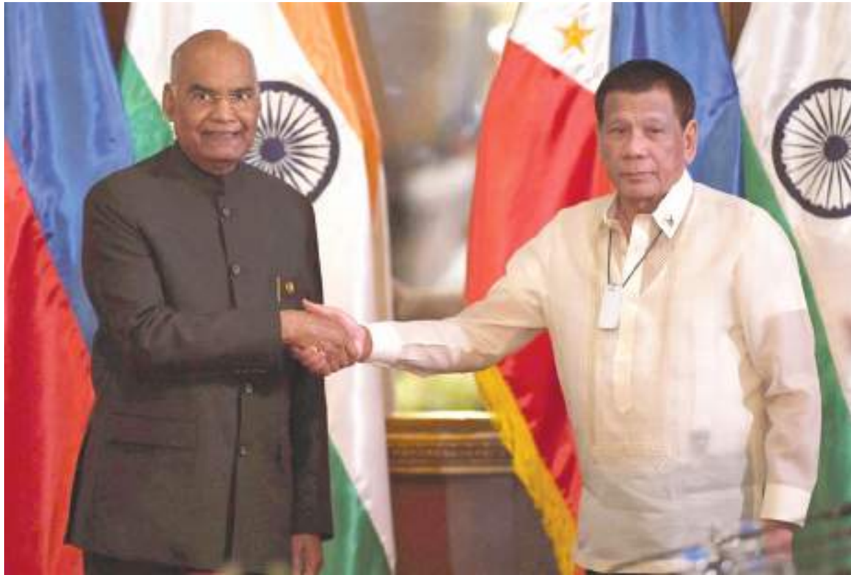
ମାନିଲା : ଫିଲିପାଇନ୍ସ ରାଷ୍ଟ୍ରପତିଙ୍କ ସହ କମମନ୍ଦିନ କରୁଛନ୍ତି ରାମନାଥ କୋବିନ୍ଦ