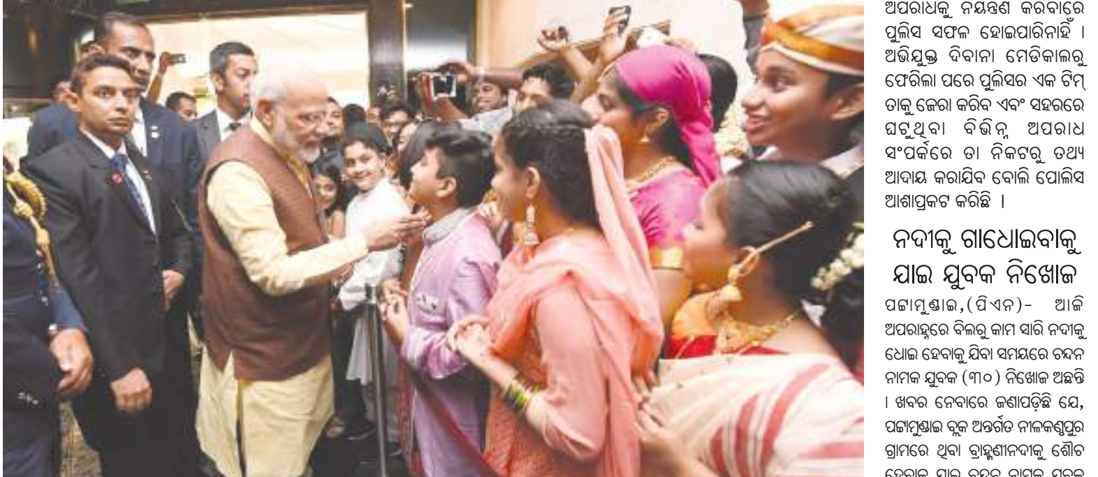
ବାହାରିନରେ ପ୍ରଧାନମନ୍ତ୍ରୀ ନରେନ୍ଦ୍ର ମୋଦି ଭାରତୀୟଙ୍କୁ ଭେଟୁଛନ୍ତି