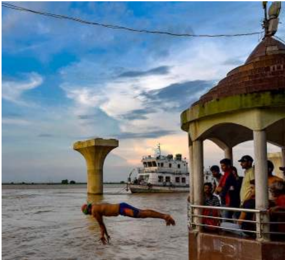
ପାଟନା : ଗଙ୍ଗା ନଦୀର ଗାନ୍ଧୀଘାଟରେ ଜଣେ ବ୍ୟକ୍ତି ପାଣକୁ ତିଆଁ ମାରୁଛନ୍ତି