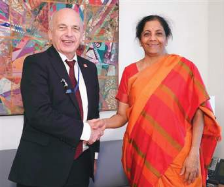
ଓଡ଼ିଶା : ସ୍ୱରାଜ୍ୟ ଅର୍ଥମନ୍ତ୍ରୀ ସହ କମମନ୍ଦିନ କରୁଛନ୍ତି ଅର୍ଥମନ୍ତ୍ରୀ ନିର୍ମଳା ସାତୋରଣୀ