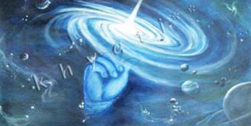
କାବନରେ କୌଣସି ଜିନିଷ ହଜିଯିବା, ହଜିଯାଇଥିବା ଜିନିଷ ସ୍ୱାଭାବିକ ଭାବେ ଘଟିଥାଏ । ଯାହା ହଜିଯିବା, କେଉଁଠି ରଖି ଖୋଜିଲେ ନ ମିଳିବ ଆଦି ସମସ୍ୟା ମନକୁ ଭାରାନ୍ତକ କରିଦିଏ । ଏଭଳି

ପରିସ୍ଥିତିରେ କାର୍ତ୍ତିକାକ୍ଷର ରାଜା ଯିଏ ହେଉ ବଂଶର ତଥା ଭଗବାନ ବିଷ୍ଣୁଙ୍କ ସୁଦର୍ଶନ ଚକ୍ରର ଅବତାର ବୋଲି କୁହାଯାଇଥାଏ । ତାଙ୍କର ସାଧନା କରିବା ଦ୍ୱାରା ଏହି ସବୁ ସମସ୍ୟାରୁ ତୁରନ୍ତ ମୁକ୍ତି ମିଳିଥାଏ । ପୁରାଣରେ ବର୍ଣ୍ଣିତ ହୋଇଛି ଯେ ସୁଦର୍ଶନ ଚକ୍ର ଯେ କୌଣସି ଦିନକୁ ଯାଇ ହଜିଥିବା ଜିନିଷ ଖୋଜି ଆଣିବାର ସାହାଯ୍ୟ କରିଥାଏ । ଏହାର ସାଧନା ପାଇଁ ଦୀପ ଜଳାଇ ପୂର୍ଣ୍ଣ ଅଥବା ଭଗବତ ଦିନ ଚକ୍ରକୁ ମୁହଁ କରି ବସନ୍ତ । ହଜିଯାଇଥିବା ଜିନିଷକୁ ଭାବନାରେ ଆଣି ଭଗବାନ ବିଷ୍ଣୁଙ୍କର ସୁଦର୍ଶନ ରୂପକୁ ସ୍ମରଣ କରି ଧ୍ୟାନ କରନ୍ତୁ ।