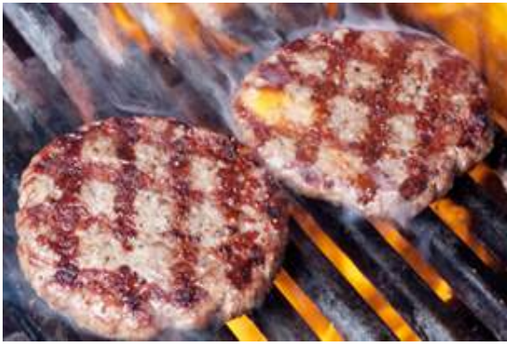
ପ୍ରତିକ୍ରିୟାରୁ ସୃଷ୍ଟି ହୋଇଛି ପାଣିକୁ ସୁକ୍ତ କରିବା ପାଇଁ ସେଥିରେ

ଆପଣଙ୍କ ଶରୀର ପାଇଁ କ୍ଷତିକାରକ ସାଦୃଶ୍ୟ ହୋଇପାରେ । ନିକଟରେ କରାଯାଇଥିବା ଏକ ଗବେଷଣାରୁ ଜଣାଯାଇଛି କୋରାମିନ୍ ସୁକ୍ତ ଖାଦ୍ୟ ଓ ଲୁଣ ପ୍ରତିକ୍ରିୟା କରି ଏଭଳି ଏକ ହାନିକାରକ ରସାୟନ ନିର୍ମାଣ କରୁଛନ୍ତି, ଯାହା ଆପଣଙ୍କୁ ଡାକ୍ତରଖାନାରେ ପହଞ୍ଚାଇଦେବ । ଗବେଷକମାନେ ଅନେକ ଅଣୁମାନଙ୍କର ସନ୍ଧାନ କରିଛନ୍ତି, ଯାହା ସମ୍ପୂର୍ଣ୍ଣ ନୂଆ ଓ କୋରାମିନ୍ ସୁକ୍ତ ପାଣି ଓ ଖାଦ୍ୟରେ ଥିବା ଆୟୋଡିନ୍, ସୁକ୍ତ ଲୁଣ ମଧ୍ୟରେ