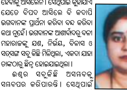
କ୍ଷୁଦ୍ର ସତ୍ତ୍ୱକି ଅସମ୍ଭବ କ୍ଷୁଦ୍ର କ୍ଷୁଦ୍ର ସଂଖ୍ୟା ହେଲା- "କଳ୍ପ ଅକଳ୍ପ ଅନୁଷ୍ଠା କଳ୍ପ ଯା ସମର୍ଥ୍ୟ ସା ଶୁଣନ୍ତୁ ।" ଯଦି ତୁ ଶୁଣନ୍ତୁ ଏକ ପରମତେଜର ଶକ୍ତି, ପରମପୁରୁଷ ପରମାତ୍ମା, ଅବକ୍ଷ୍ମ, ନିର୍ଦ୍ଦୋଷ, ନିରାକାର ଅଚଳ, ଭକ୍ତର ମନୋବାଞ୍ଛା ପୂର୍ଣ୍ଣ କରିବା ପାଇଁ ସେ ମଧ୍ୟ ବେଦନେବେକ ବ୍ୟକ୍ତ କରୁଥିଲେ । ସାକାର, ସାକାର, ରୂପକୁ ଗ୍ରହଣ କରିଥାନ୍ତି । ଭକ୍ତ ସୁଦ୍ଧାମାନ ଅନ୍ତର କଥାକୁ ଯୋଜନା ଯୋଜନା ଦୂରରେ ଥାଇ ଜାଣିପାରନ୍ତି ପ୍ରଭୁ । ଶୁଣିପାରନ୍ତି ଚିତ୍ତୋପାୟ, ମୁଗୁଣୀ, ଗଜର ଜଣାଣକୁ । ଭକ୍ତ ସାଲବେଗର ଅବସ୍ଥାକୁ ହୃଦୟଙ୍ଗମ କରି ଅନେକାଳ ଦିଅନ୍ତି ନିର୍ଦୋଷ ରଥ ବଡ଼ ଦାଣ୍ଡରେ । ବନ୍ଧୁ ମହାନ୍ତି, ଭକ୍ତ ବଳରାମ ଦାସର ହୃଦୟର ଆବେଗ ନିକଟରେ ହାର ମାନନ୍ତି ପ୍ରଭୁ । ମାତାବାଇଙ୍କ ପାଇଁ ଜହର ପାଳନ୍ତିଯାଏ ଅମୃତ । ତୁଳସୀବାସଙ୍କ ପାଇଁ ପ୍ରଭୁ ଶ୍ରୀରାମ ମାଳତୀ ନଦୀକୁ ଚୁରୁରେ ଉପସ୍ଥିତ ହୋଇପାରନ୍ତି ତାଙ୍କ କୁଟୀର ନିକଟରେ । ପୁଣି ଗର୍ବଗଞ୍ଜନ ପ୍ରଭୁ କାଳେକାଳେ ଅନ୍ୟାୟ, ଅଧର୍ମ, ଅସତ୍ୟ ଓ ଅଜ୍ଞାନତାକୁ ବିନାଶ କରିବା ପାଇଁ ଏ ଧରାଧାମାକୁ ଓହ୍ଲାଇ ଆସନ୍ତି ଭିନ୍ନଭିନ୍ନ ଅବତାର ନେଇ ।

ହେବାକୁ ଆସିଲେନି । ସେଥିପାଇଁ କୁହାଯାଏ ଯେତେ ବିପଦ ଆସିଲେ ବି କାପାରି ଭଗବାନଙ୍କ ପ୍ରାର୍ଥନା କରିବା ବନ୍ଦ କରିବା ହେଲାଭଳି ଠାକୁରଙ୍କ ପୂଜାରେ, ଠାକୁରଙ୍କୁ ସଜେଇବାରେ, ଠାକୁରଙ୍କ ଭଜନ, ଜଣାଣ, ଶ୍ରେଷ୍ଠକୁ ବଡ଼ ପାଟିରେ ନିରତର ବୋଲିବା ବ୍ୟର୍ଥ ଅଟେ । ଶୁଣନ୍ତୁ ଏହି ସତ୍ତ୍ୱ ବାସ୍ତବ ଆଚରଣ ଅପେକ୍ଷା ଭକ୍ତିର ଅନ୍ତର୍ନିହିତ ହେବାକୁ ବିଶେଷ ଭାବରେ ଗୁରୁତ୍ୱ କରିଥାଆନ୍ତି । ଏଥିପାଇଁ ଶରୀରକୁ ବନ୍ଦ ଦେଇ ନାନା ଓଷା ବ୍ରତ କରିବା ମଧ୍ୟ କରୁଛନ୍ତୁ ନୁହେଁ । ଅନେକ ସାଧୁ, ସତ୍ତ୍ୱ, ମୁନି, ରକ୍ଷି ଭାବି ଏକାନ୍ତରେ ବସି ଘଣ୍ଟା ଘଣ୍ଟା ତପସ୍ୟା ବା ଧ୍ୟାନ କରିବା ଦ୍ୱାରା ଶୁଣନ୍ତୁ ମିଳିଥାନ୍ତି । ଶୁଣନ୍ତୁ କିନ୍ତୁ ଭକ୍ତ ହୃଦୟେ ଅନାବିଳ ଭକ୍ତି ଓ ସଂକ୍ଷୟମାନ ବିଶ୍ୱାସକୁ ପରିମାପକ ରୂପେ ବ୍ୟବହାର କରି ଭକ୍ତିର କେତେ ଧରଣ ଦେଖିଥାନ୍ତି । କିନ୍ତୁ ମହାରାଜାଙ୍କଠାରୁ ସତ୍ତ୍ୱ କିଛି ନେଇଯିବା ପରେ ବାମନ ଭଗବାନ ତାଙ୍କର ଭୃତ୍ୟ ହୋଇ ରହିଗଲେ । ସେ ତାଙ୍କ ଭୃତ୍ୟ ପରି, ହାତରେ କମଣ୍ଡଳୁ ଧରି ଛିଡ଼ା ହେଲେ । କୁହାଯାଏ କି ବକାଳ ରାଜତ୍ୟାସ ପୂତକ ଲୋକରେ ୧୨ଟି ପ୍ରବେଶ ଦ୍ୱାର ଥିଲା । ରାଜା ସେତେ ବକାଳ ସହିତ ଯୁଦ୍ଧ କରିବାକୁ ଗଲେ । କେହି ତାଙ୍କୁ ଚୋରିକିଲେ ନାହିଁ । କିନ୍ତୁ ସେ ଯେତେବେଳେ ବକାଳ ଦ୍ୱାରରେ ପହଞ୍ଚିଲେ, ଦେଖିଲେ ଜଣେ ବାମନ ହାତରେ କମଣ୍ଡଳୁ ଧରି ଛିଡ଼ା ହୋଇଛନ୍ତି । ସେ ଯେଉଁ ପ୍ରବେଶ ଦ୍ୱାରକୁ ଗଲେ ବି ସେଠାରେ ସେହି ବାମନଙ୍କୁ ଛିଡ଼ା ହୋଇଥିବାର ଦେଖିଲେ । ଏଥିରେ ରାଜା ତକିତ ହୋଇ ପଚାରିଲେ, ତୁମେ କିଏ ଓ କାହିଁକି ମୋତେ ପ୍ରବେଶ କରିବାକୁ ଦେଲେ । ବାମନ କହିଲେ ତାହା ପ୍ରବେଶ କରିବାର ପ୍ରକୃଷ୍ଟ ସମୟ ନୁହେଁ । ରାଜା ସଂସ୍ତରେ ଉତ୍ତରକୁ ହୋଇଗଲେ । ସେ ତାଙ୍କୁ ଉଠାଇ ଫିଙ୍ଗି ଦେବାକୁ ଧମକ ଦେଲେ । ଏକଥା ଶୁଣିବା ପରେ ବାମନ ଭଗବାନ ତାଙ୍କୁ ବାମ ପାଦର ଅଳ୍ପଠିରେ ରାଜାଙ୍କୁ ଠେଲିଦେଲେ । ରାଜାଙ୍କୁ ସେ ଠେଲି ସ୍ତରକୁ ଲୋକକୁ ଲାଜକୁ ପଠାଇଦେଲେ । ଏହି ଘଟଣା ପରେ ସେ ଆଉ କେବେବି ବକାଳ ସହ ମୁହାଁମୁହିଁ