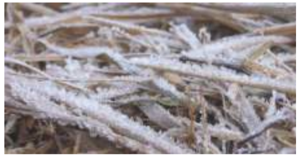
ସୋନପୁରର ସର୍ବନିମ୍ନ ତାପମାତ୍ରା ୩.୪ ଡିଗ୍ରୀ ରାଜ୍ୟର ୧୫ଟି ସ୍ଥାନରେ ତାପମାତ୍ରା ୧୦ ଡିଗ୍ରୀ ତଳକୁ

ଭୁବନେଶ୍ୱର, (ପିଏନ)- ସମଗ୍ର ଓଡ଼ିଶାରେ ଶୀତ ଲହରୀ ଦେଖା ଦେଇଛି । ଉତ୍ତର ଓଡ଼ିଶାରେ ଶୀତ ଲହରୀ ଲୋକ ମାନଙ୍କୁ ନାହିଁ ନ ଥିବା ଅସୁବିଧାର ସମ୍ମୁଖୀନ ହେଉଛନ୍ତି । ସୋନପୁର ଠାରେ ରାଜ୍ୟର ସର୍ବ ନିମ୍ନ ତାପମାତ୍ରା ୩.୨ ଡିଗ୍ରୀ ସେଲସିୟସ୍ ରେକର୍ଡ କରା ଯାଇଛି । ଶନିବାର ଦିନ ରାଜ୍ୟର ୯ଟି ସ୍ଥାନରେ ତାପମାତ୍ରା ୧୦ ଡିଗ୍ରୀରୁ କମ ଥିବା ବେଳେ ରବିବାର ଦିନ ୧୫ ଟି ସ୍ଥାନରେ ତାପମାତ୍ରା ୧୦ ଡିଗ୍ରୀରୁ ତଳେ ରହିଛି । ପାଣି ପାଗ ବିଭାଗରୁ ମିଳିଥିବା ସୂଚନା ଅନୁସାରେ ସୋନପୁର ପରେ ଅନୁଗୋଳରେ ସର୍ବନିମ୍ନ ତାପମାତ୍ରା ୪.୬ ଡିଗ୍ରୀ ରହିଥିବା ବେଳେ ପୁଲଘାଣାରେ ୫ ଡିଗ୍ରୀ ତଥା ବାରିଶିବାତିରେ ସର୍ବନିମ୍ନ ତାପମାତ୍ରା ୫.୫ ଡିଗ୍ରୀ ସେଲସିୟସ୍ ରେକର୍ଡ କରା ଯାଇଛି । ସେହିପରି ଚିଟିଲାଗଡ଼ରେ ୬.୧ ଡିଗ୍ରୀ, ଉଦାପାଟଣାରେ ୬.୫ ଡିଗ୍ରୀ, ଝାରସୁଗୁଡ଼ାରେ ୭.୩ ଡିଗ୍ରୀ, ସମଲପୁର ଠାରେ ୭.୪ ଡିଗ୍ରୀ, ବଲାଙ୍ଗୀର ଠାରେ ୮ ଡିଗ୍ରୀ, ବାଲେଶ୍ୱର ଠାରେ ୮.୬ ଡିଗ୍ରୀ ସେଲସିୟସ୍