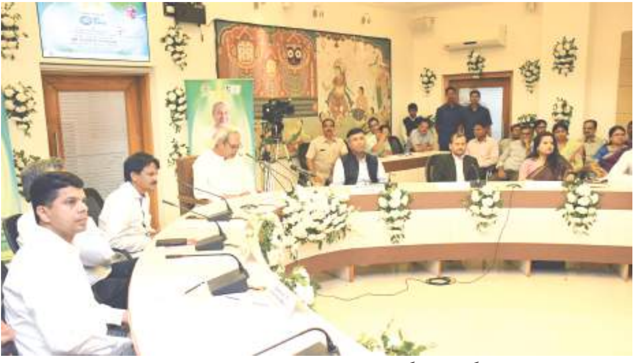
ଲୋକସଭା ଭବନରେ ମୁଖ୍ୟମନ୍ତ୍ରୀ ନବୀନ ପଟ୍ଟନାୟକ ଶ୍ରମ ଓ ଇଂସାଧନ ବିଭାଗର 'ମୋ ସରକାର' କାର୍ଯ୍ୟକ୍ରମରେ ଅନ୍ତର୍ଭୁକ୍ତ କରିବା ଘୋଷଣା ଅବସରରେ