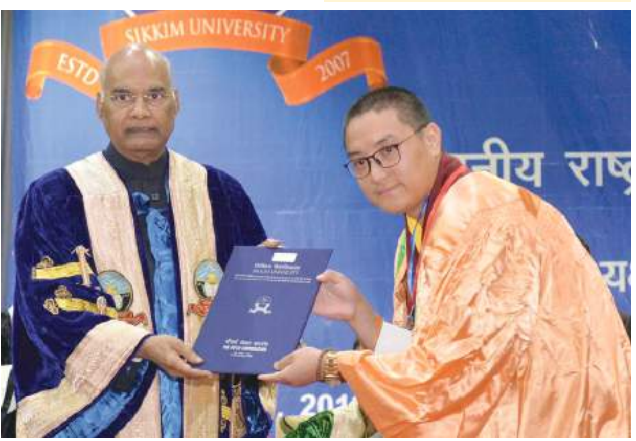
ସିକ୍କିମ ବିଶ୍ୱବିଦ୍ୟାଳୟର ସମାବର୍ତ୍ତନ ଉତ୍ସବରେ ରାଷ୍ଟ୍ରପତି ରାମନାଥ କୋବିର

ଫଟୋ କାହା କରୁଛି ଯେଉଁଥିରେ ବଙ୍ଗଳାଦେଶରୁ ଆସିଥିବା ମୁସ୍ଲିମ୍ ଆତଙ୍କବାଦୀ ଓ ଇଜିପ୍ଟର ଆତଙ୍କବାଦୀ ସଂଗଠନ ସିନାଲର ସଦସ୍ୟ ମାନେ ଆଇଏସଆଇଏସ ର ପତାକା ତଳେ ଆତଙ୍କବାଦୀ ବେଦ ଅତ୍ୟନ୍ତ ଲଜ୍ଜାକରକ ଘଟଣା ।