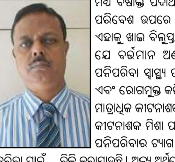
ଭୁବନେଶ୍ୱର (ପିଏନ୍): ପରିପରିବାକୁ ରୋଗ ଯୋଗ ଦାଉରୁ ରକ୍ଷା କରିବା ପାଇଁ କୃଷି କ୍ଷେତ୍ରରେ କାର୍ତ୍ତବ୍ୟ ଉପକରଣ ବ୍ୟବହାର କରାଯାଉଛି ।