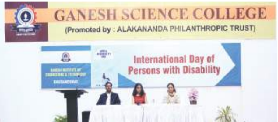
ଭୁବନେଶ୍ୱର : ଗଣେଶ ବିଜ୍ଞାନ ମହାବିଦ୍ୟାଳୟ ଅକ୍ଷାରୁଆ ଭୁବନେଶ୍ୱରରେ ଆନ୍ତର୍ଜାତୀୟ ଭିନ୍ନକ୍ଷମ ସାମ୍ପ୍ରଦାୟ ଦିବସ ପାଳନ କରିବେ ।