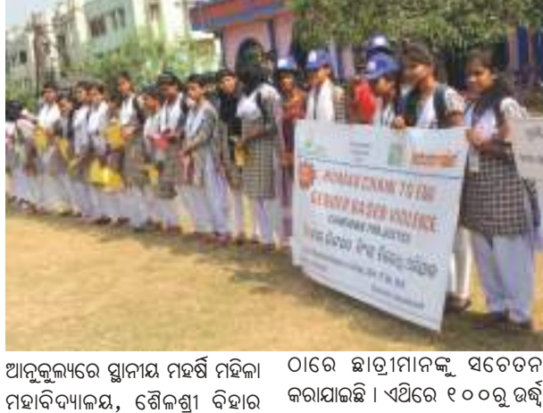
ଭୁବନେଶ୍ୱର : ପ୍ରତ୍ୟେକ ମହିଳା ଓ କନ୍ୟା ସନ୍ତାନଙ୍କ ସୁରକ୍ଷା ଆମ ସମସ୍ତଙ୍କର ଦାୟିତ୍ୱ ।

ଭୁବନେଶ୍ୱର : ପ୍ରତ୍ୟେକ ମହିଳା ଓ କନ୍ୟା ସନ୍ତାନଙ୍କ ସୁରକ୍ଷା ଆମ ସମସ୍ତଙ୍କର ଦାୟିତ୍ୱ । ଏହା ଉପରେ ଆଲୋଚନା କରାଯାଇଛି ।