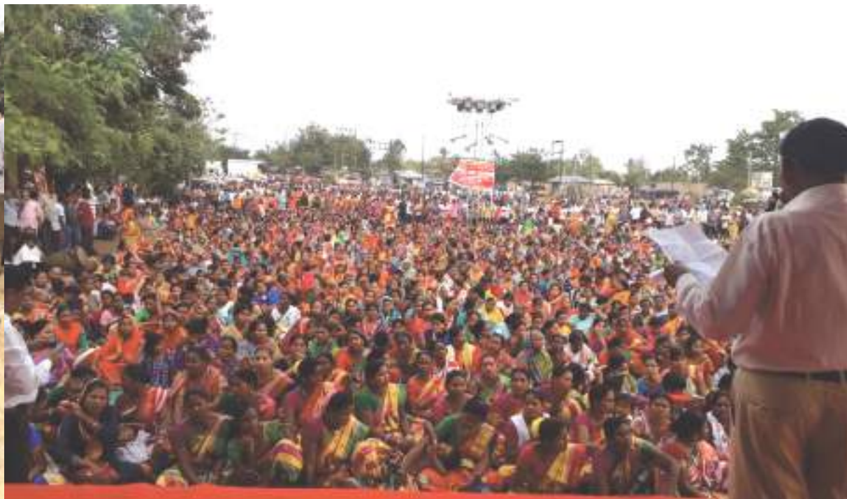
ବନ୍ଧି ଉଛେଦ ପ୍ରତିବାଦରେ ସାଲିଆ ସାହି ବନ୍ଧି ଉନ୍ମତ୍ତ ନିହାସଂଘର ବିଶାଳ ଗଣ ସମାବେଶ