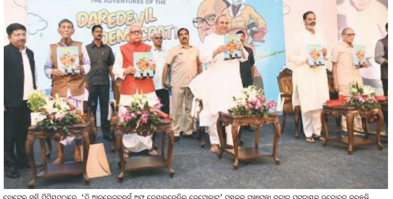
ହୋଟେଲ ସ୍ୱିସ୍ ପ୍ରିମିୟମରେ 'ଦି ଆଡ଼ଭେନ୍ଚରସ୍ ଅଫ ଡାରେଭିଲ୍ ଡେମୋକ୍ରେଟି' ପୁସ୍ତକକୁ ମୁଖ୍ୟମନ୍ତ୍ରୀ ନବୀନ ପଟ୍ଟନାୟକ ଉନ୍ମତ୍ତ ନିହାସଂଘରୁ ପ୍ରଦାନ କରୁଛନ୍ତି

ନୂଆଦିଲ୍ଲୀ, ୬।୩।(ପି.ଏନ) : ଉପରପ୍ରଦେଶ ମୁଖ୍ୟମନ୍ତ୍ରୀ ଯୋଗୀ ଆଦିତ୍ୟନାଥ ଶୁକ୍ରବାର ଦିନ ରାଷ୍ଟ୍ରପତି ଭବନରେ ରାଷ୍ଟ୍ରପତି ରାମ ନାଥ କୋବିନ୍ଦଙ୍କୁ ଭେଟିଛନ୍ତି । ରାଷ୍ଟ୍ରପତିଙ୍କ ସଚିବାଳୟ ପକ୍ଷରୁ ଉତ୍ତମ ଯାକାତର ଫଟୋ ଦ୍ୱିତରରେ ଶୋଭା କରାଯାଇଛି । ସୁତରାଫା ଯୋଗୀ ସେ ଗୁରୁବାର ପୂର୍ବରୁ ଆଦିତ୍ୟନାଥ କେନ୍ଦ୍ର ଗୃହମନ୍ତ୍ରୀ ଅମିତ ଶାହାଙ୍କୁ ଭେଟି ରାଜ୍ୟର ବିଭିନ୍ନ ପ୍ରସଙ୍ଗ ଉପରେ ଆଲୋଚନା କରିଥିଲେ ।