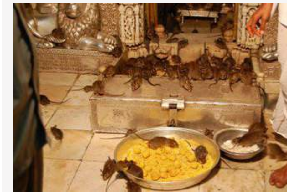
ଭାରତର ରାଜସ୍ଥାନରେ ବିଭିନ୍ନ ପ୍ରକାର ଲୋକ ଦେଖିବାକୁ ମିଳୁଥିବା ବେଳେ ସେମାନଙ୍କର ପରମ୍ପରା ମଧ୍ୟ ଅଲଗା ପ୍ରକାରର ହୋଇଥାଏ । ଥାର ମରୁଭୂମି ନିକଟରେ ଦେଶନାକେ ନାମକ ଏକ ଛୋଟ ସହର ରହିଛି । ଏହି ମନ୍ଦିର ସେଠାରେ ଥିବା ସବୁଜି ନିୟୋଜିତ କରାଯାଇଥିଲା ।

ଅନ୍ୟ ହିନ୍ଦୁ ମନ୍ଦିର ମଧ୍ୟରୁ ଗୋଟିଏ । କରଣା ମନ୍ଦିରକୁ ନେଇ ଲୋକମାନଙ୍କ ମନରେ ଅନେକ ଆଧ୍ୟାତ୍ମିକ ଭାବନା ରହିଛି । ମନ୍ଦିରରେ କରଣା ମାତାଙ୍କ ପୂଜା କରିବା ସହିତ ସେଠାରେ ମୁଷାମାନଙ୍କୁ ମଧ୍ୟ ପୂଜା କରାଯାଏ । ଆଶ୍ଚର୍ଯ୍ୟର କଥା ସେଠାରେ ଗୋଟିଏ ଦୁଇଟି ମୁଷା ନୁହେଁ ବରଂ ପାଖାପାଖି ୨୦ହଜାର ମୁଷା ରହନ୍ତି ସେହି ମନ୍ଦିରରେ । ସେଠାକାର ମୁଷାମାନେ କବାଟ ନାମରେ ପରିଚିତ । ଲୋକକଥା ଓ ପରମ୍ପରା ଅନୁସାରେ, ମୁଷାମାନଙ୍କୁ ନେଇ ଦୁଇଟି କାହାଣୀ ରହିଛି । କୁହାଯାଏ ସେଠାରେ ଜନ୍ମ ହୋଇଥିବା ସବୁ ଶିଶୁ ମୁଷା ହୋଇ ଏକ ଛୋଟ ସହର ରହିଛି । ଜନ୍ମ ନେଲେ । ଦ୍ୱିତୀୟତଃ ଯେଉଁଠାରେ କରଣା ମାତା ମନ୍ଦିର ୨୦ହଜାର ମୁଷାଙ୍କୁ ସୈନିକ ରହିଛି । ଏହି ମନ୍ଦିର ସେଠାରେ ଥିବା ସବୁଜି ନିୟୋଜିତ କରାଯାଇଥିଲା ।